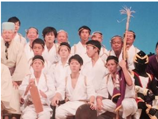
国場 ウズンビーラの皆さん